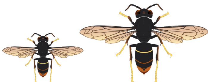
Fondatrice (20 à 32 mm)