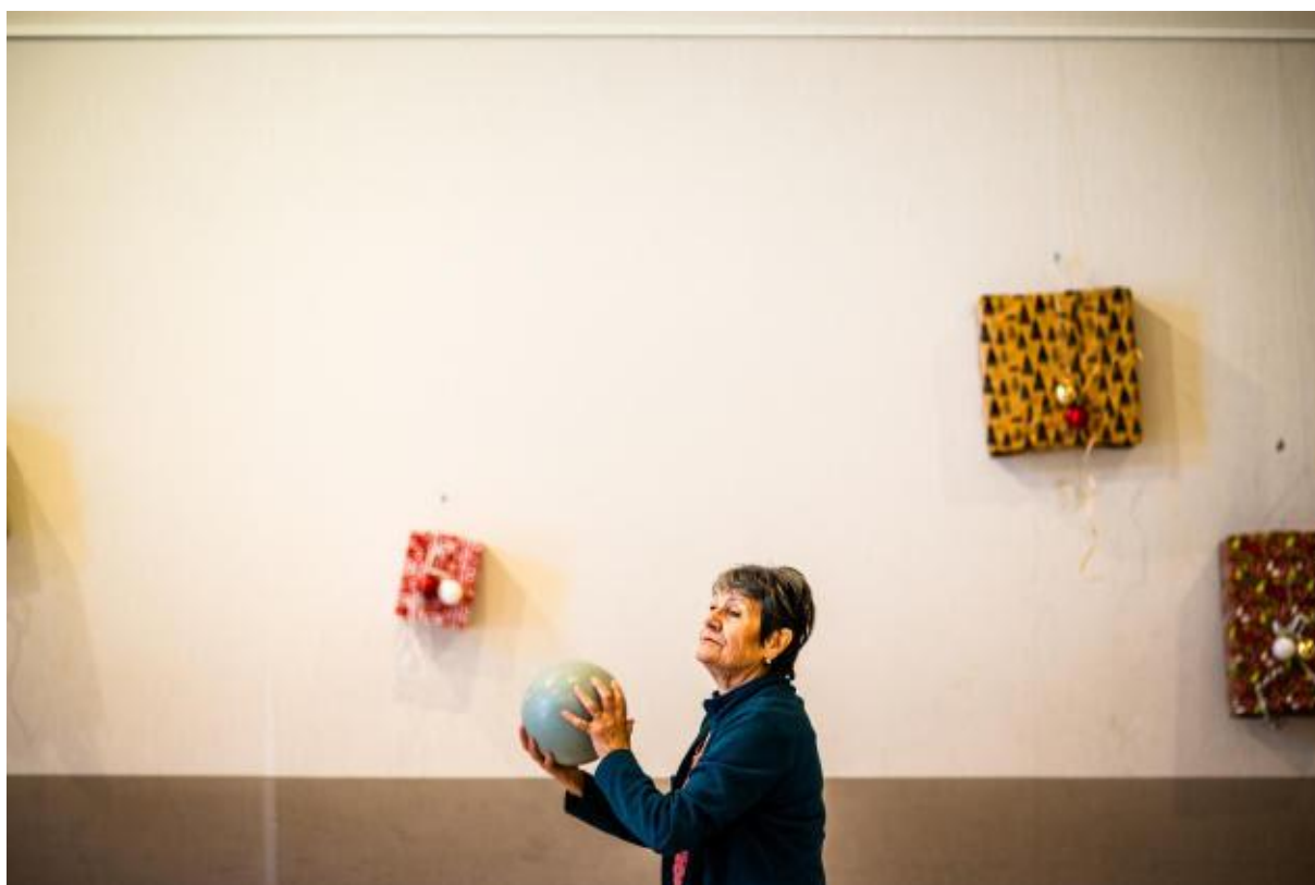
Travail de coordination avec un ballon, à Tresserre (Pyrénées-Orientales), le 24 janvier 2023.

Parmi ces villages, Bélesta, Le Vivier, Oms, Molitg-les-Bains et Serdinya-Joncet bénéficient de ce gymnase mobile, qui propose une trentaine d'activités, du sport collectif (basket-ball, football) aux jeux traditionnels (quilles catalanes, palet breton, tir à la corde).