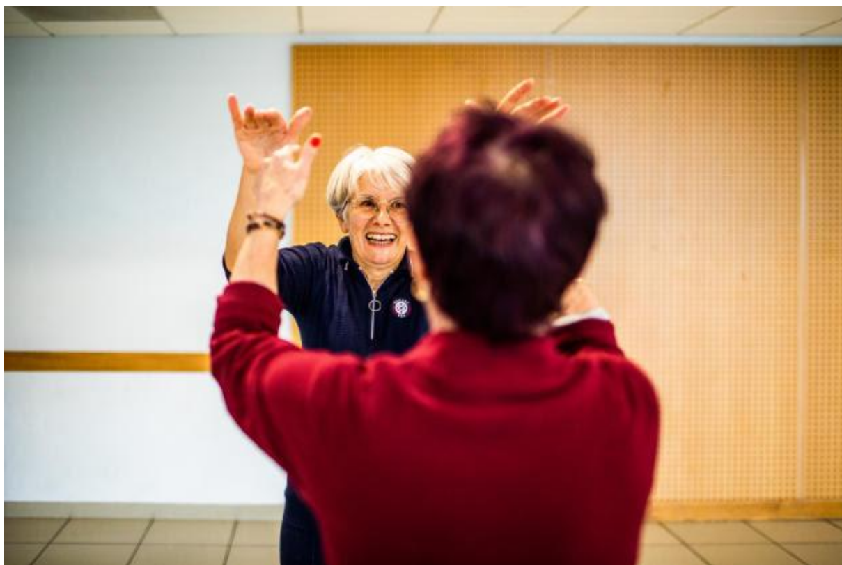
Exercices et bonne humeur lors de la séance de sport, à Llauro (Pyrénées-Orientales), le 24 janvier 2023.

Si le Mobil'Sport des Pyrénées-Orientales est le plus dynamique de France, avec six cents ateliers organisés en 2022, la pérennité du concept est loin d'être assurée. Les prestations à titre gratuit ne durent qu'un temps et, pour maintenir les activités auprès des communes sur le moyen terme, « il nous faut trouver d'autres solutions financières , précise M. Beinse. Cela me prend un temps fou, mais je ne veux pas abandonner le milieu rural ».