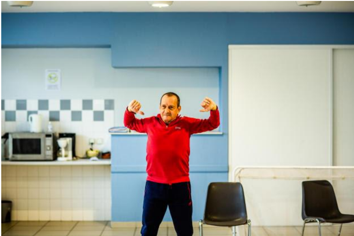
Etirements en fin de séance de sport, à Llauro (Pyrénées-Orientales), le 24 janvier 2023.