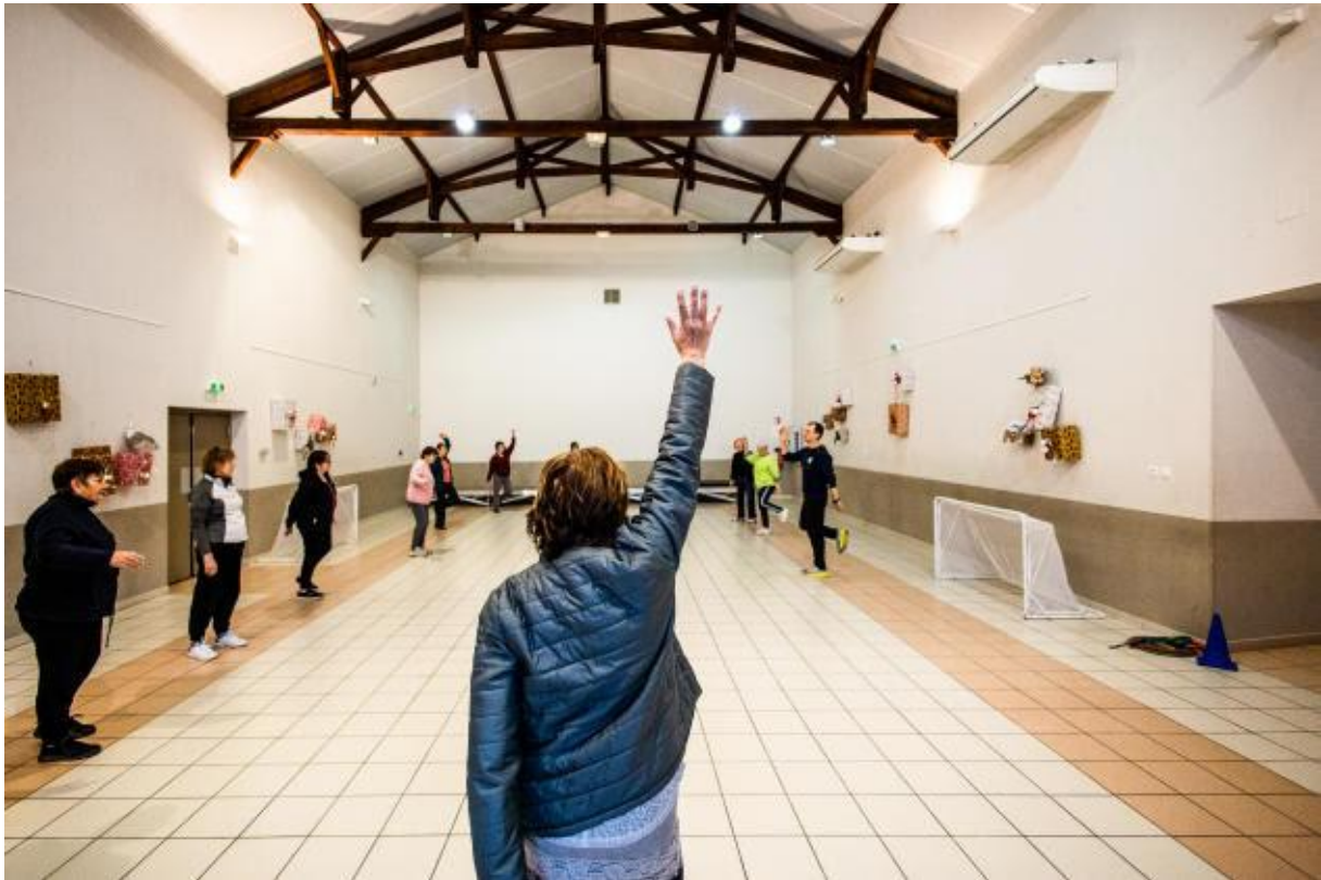
Début des premiers ateliers avec un échauffement collectif, à Tresserre (Pyrénées-Orientales), le 24 janvier 2023.